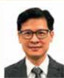
楊耀輝先生 房屋署副署長(屋邨管理)