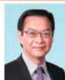
韋志成先生，金紫荊星章， 太平紳士 市區重建局行政總監