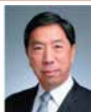
李春掣先生 房屋經理註冊管理局主席