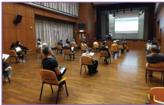
▲ 民政事務總署和物業管理業監管局早前舉行多場簡介會，向物業管理業界和業主組織介紹「物業管理業界抗疫支援計劃」。