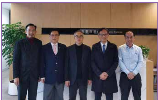
◀ 民政事務局於2月20日上午與物業管理、清潔及保安業界代表會面，介紹「防疫抗疫基金」下的「物業管理業界抗疫支援計劃」的相關細節。建築、測量、都市規劃及園境界立法會議員兼物業管理業監管局主席謝偉銓（右二）、香港物業管理公司協會會長陳志球博士（左二）、香港服務同盟召集人甄韋喬博士（左一）及香港註冊保安導師學會會長黃輝成（右一）一同出席會議。