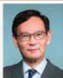
首席評審 謝偉銓先生，銅紫荊星章 物業管理業監管局主席