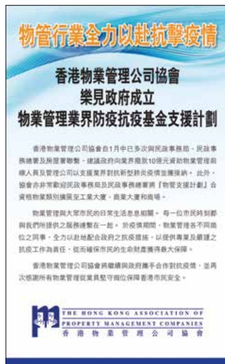
▲ 2020年4月23日於香港經濟日報協會新聞稿