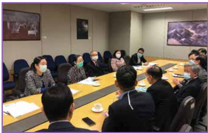
▲ 民政事務局局长於4月9日與物業管理、清潔及保安業界代表會面，就優化「防疫抗疫基金」下的「物業管理業界抗疫支援計劃」聽取意見。